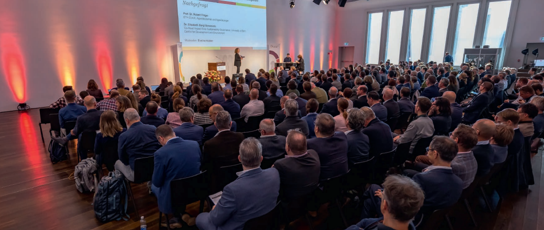
Forum in der Messe Luzern