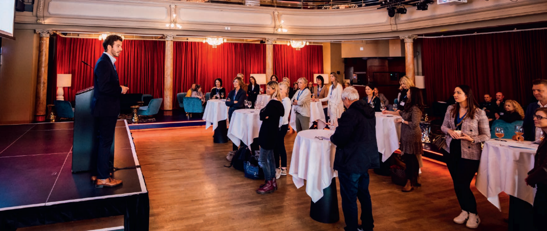
Kundenanlass im Grand Casino Luzern